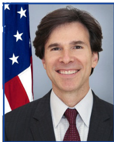
Velvyslanec USA Andrew Schapiro

V rámci zasedání, které uvedl Andrew H. Schapiro, velvyslanec USA v České republice, zazněly od účastníků inspirativní příklady dobré praxe v oblasti dárcovství a dobrovolnictví a v druhé části zasedání byl strukturovaným brainstormingem zachycen nejen aktuální stav dárcovství a dobrovolnictví v regionu, ale i témata a výzvy do budoucna.