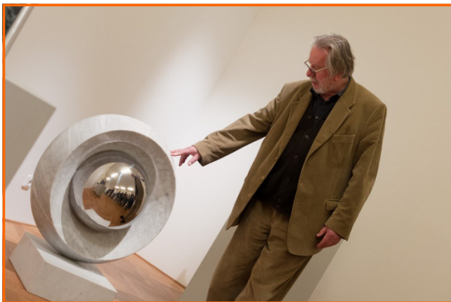
mramorové plastiky jsou výjimečné především svou uměleckou hodnotou

Historicky první Čaj o páté se uskutečnil 4. března 2015 v prostorách kavárny Muzea města Ústí nad Labem. Naše pozvání přijal a naším prvním hostem se stal profesor Klaus Horstmann-Czech, rodák z Ústí nad Labem, který v roce 2011 obohatil sbírky Muzea města Ústí nad Labem cenným souborem moderních mramorových plastik v hodnotě přes 3,5 mil. korun a tím se zařadil mezi nejvýznamnější mecenáše ústeckého muzea v celé jeho 135leté historii.