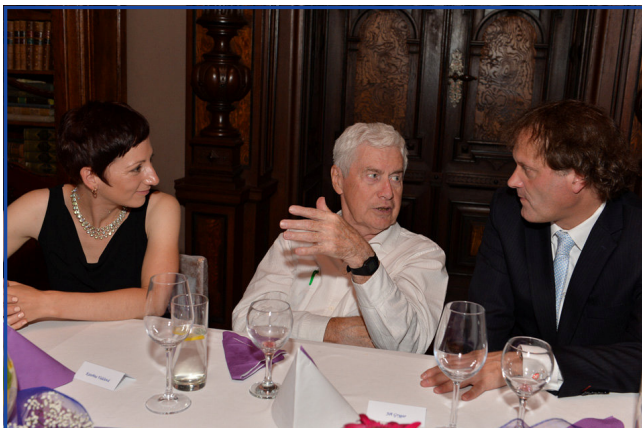
Jiří Grygar při rozhovoru s předsedou správní rady nadace panem Lud'kem Masopustem.

Benefiční večeře, na kterou přijal pozvání významný český astronom a astrofyzik Jiří Grygar, vynesla 141 000 Kč. Na padesát hostů se výborně bavilo. Otázky byly jak vážně vědecké, při kterých bylo třeba oprášit znalosti z fyziky na poměrně vysoké úrovni, ale i odlehčené zaměřené například na udělování ocenění Bludných balvanů při Českém klubu skeptiků SISYFOS, což je vlastně anticena za pseudovědeckou činnost.