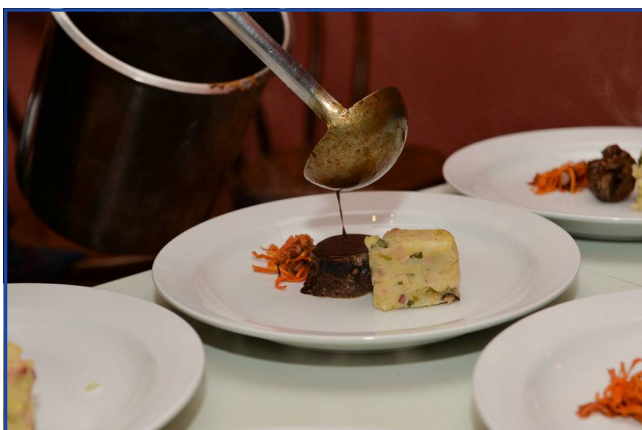
hlavní chod... pomalu tažený sous – vide hovězí špalek, podávaný se staročeským šťouchaným brambůrkem a omáčkou demi – glacé